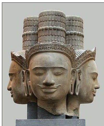
CHATEAUNEUF du Rhône, Viviers